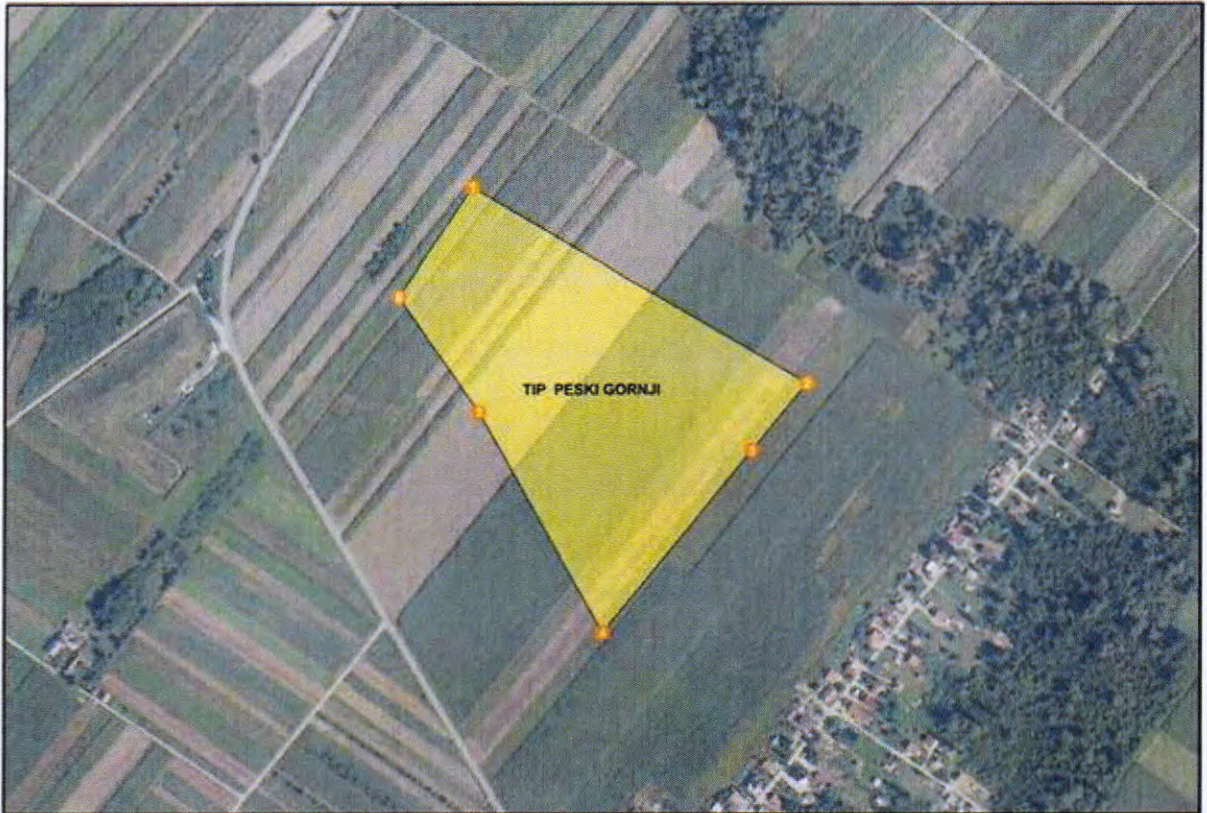
Grafički prikaz traženog istražnog prostora građevnog pijeska i šljunka "Peski gornji":